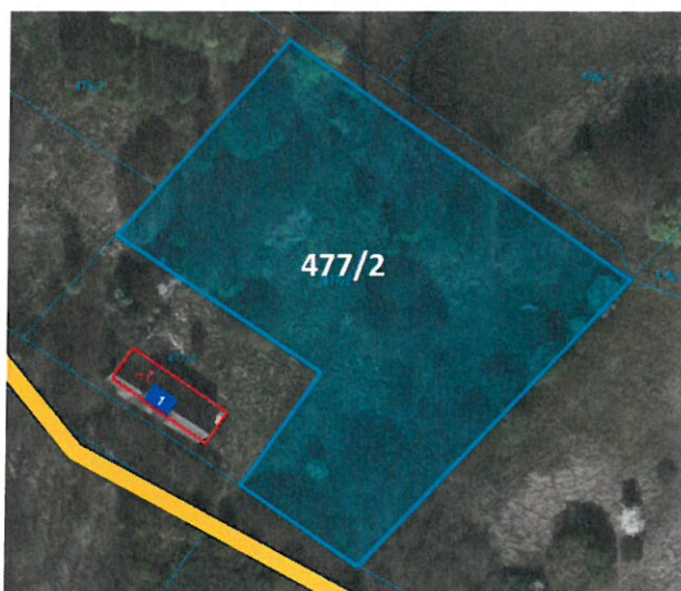
Osowa Sień, przysiółek Wincentowo