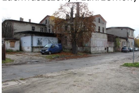
widok od ulicy Garbarskiej

Nieruchomość położona przy ul Garbarskiej 28, pośród innych działek zabudowanych, bezpośrednio granicząca z działkami zabudowanymi. Częściowo zabudowana zespołem budynków po byłej mleczarni o łącznej powierzchni zabudowy 2130 m 2 . Teren nieruchomości płaski, zachwaszczony i zakrzewiony. Działka jest ogrodzona.