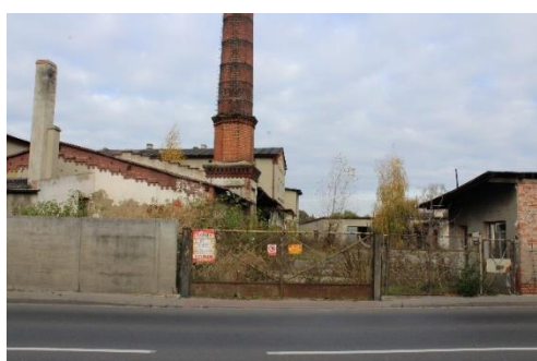
widok od ulicy Moniuszki