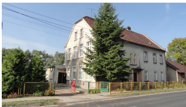
widok od ulicy głównej

Nieruchomość położona w miejscowości Przyczyna Górna, numer porządkowy 22. Lokalizacja nieruchomości korzystna w centralnej części miejscowości, blisko granicy miasta Wschowa, pośród gruntów zabudowanych, zabudowy mieszkaniowej jednorodzinnej i zagrodowej. Nieruchomość położona pośród innych działek zabudowanych, bezpośrednio granicząca z działkami zabudowanymi. Kształt nieruchomości korzystny, zbliżony do wieloboku. Nieruchomość częściowo zabudowana zespołem budynków po byłej szkole podstawowej o powierzchni zabudowy 205 m 2 , 109 m 2 i 93 m 2 . Nieruchomość jest ogrodzona. Teren nieruchomości płaski, działki są zagospodarowane, wygradzone, częściowo urządzone dojścia i dojazdy, obiekty małej architektury oraz pojedyncze nasadzenia roślinne.