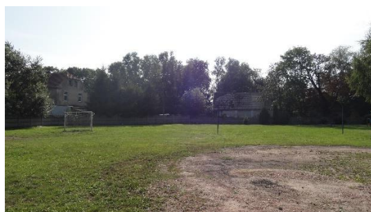
widok od podwórza