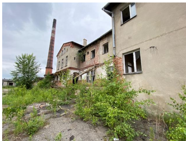
widok od podwórza