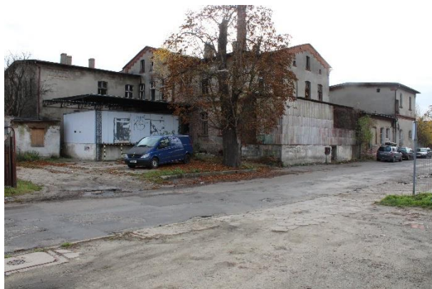
widok od ulicy Garbarskiej

budynków po byłej mleczarni o łącznej powierzchni zabudowy 2130 m 2 . Teren nieruchomości płaski, zachwaszczony i zakrzewiony. Działka jest ogrodzona.