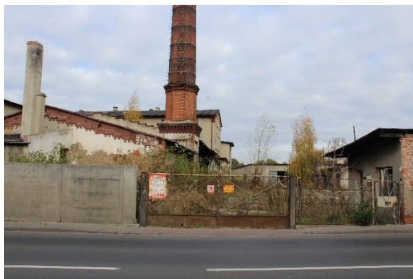
widok od ulicy Moniuszki